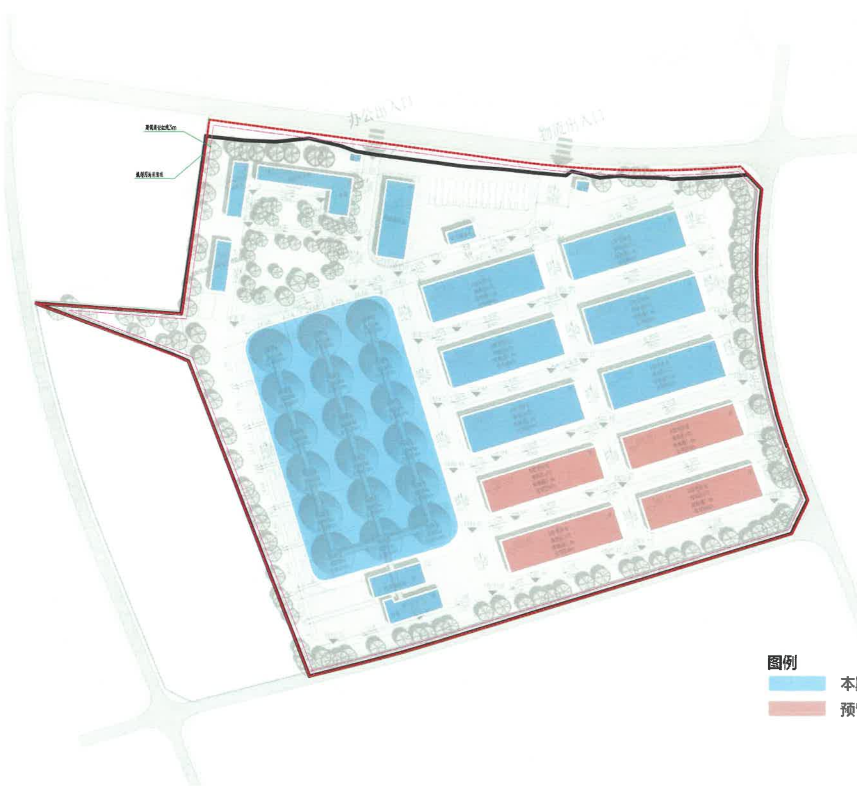
图例 ■ 本期新建建、构筑物 ■ 预留建、构筑物